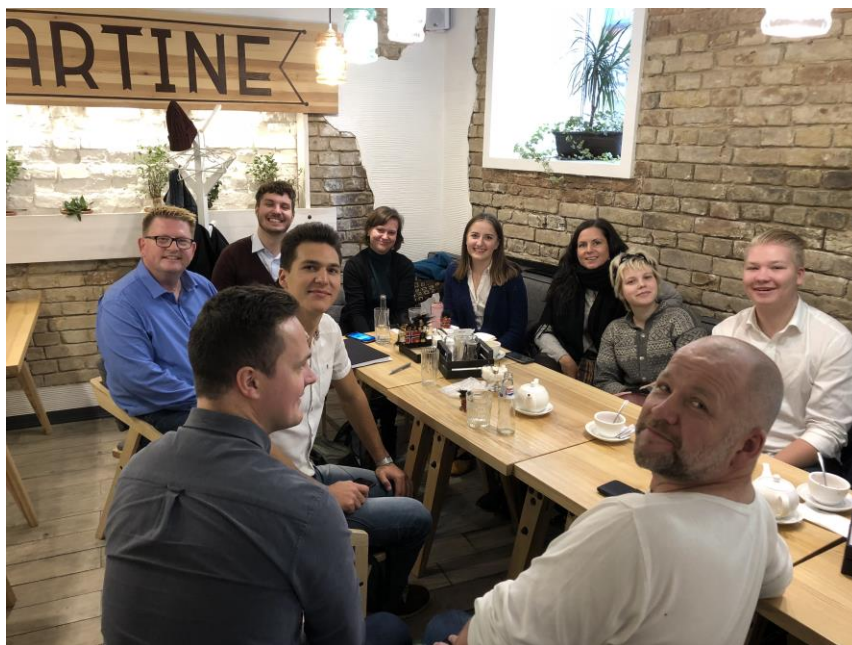
ABUR-styret sammen med representanter for National Youth Council of Ukraine og ungdomspolitiske representanter.