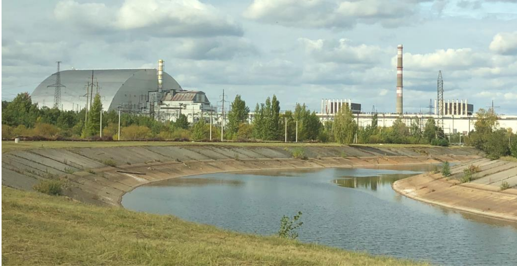
Atomreaktoren i Tsjernobyl med den nye sarkofagen til venstre.